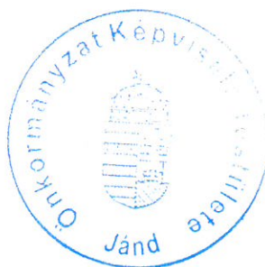
Asztalos István polgármester

A Képviselő-testület hatáskörét gyakorló: